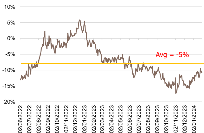
Figure 3: Still trade at discount after divesting THCOM