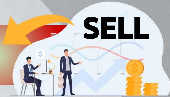
Daily: Top 10 NVDR Net Sell Value