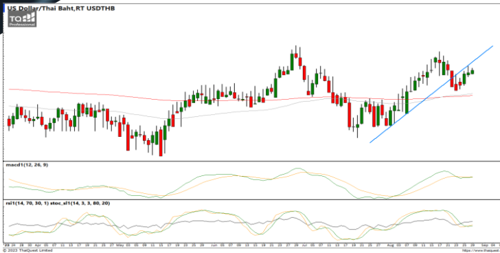
กลยุทธ์ Trading Short ในรอบ 35.40 – 34.60

38.2%: 119.29 51.25%: 108.98 61.6%: 99.19