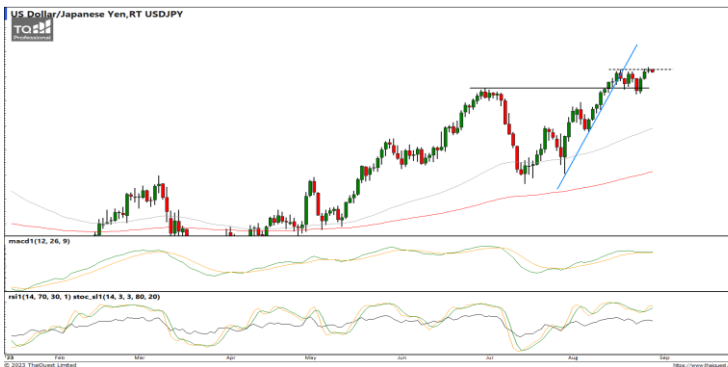
กลยุทธ์ Wait and see.

ทดสอบแนวรับที่เส้นแนวโน้มขาขึ้นแล้วพยายามรีบาวด์กลับขึ้นบ้าง ขณะที่เครื่องมือทางเทคนิค MACD, RSI และ SSto พยายามยกตัวขึ้น ทำให้คาดว่าราคามีโอกาสรีบาวด์กลับขึ้นได้ แนวรับ 1.0765 / 1.0680 แนวต้าน 1.0877 / 1.0921