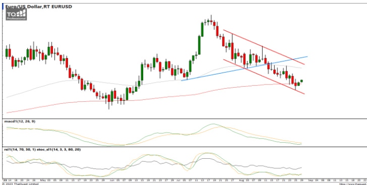
กลยุทธ์ Trading Short ในรอบ 1.0921 – 1.0770

ทดสอบแนวต้านที่เส้นแนวโน้มขาขึ้นแล้วเริ่มชะลอกำลังลงบ้างเล็กน้อย ขณะที่เครื่องมือทางเทคนิค MACD, RSI และ SSto ชะลอกำลังลงบ้างแล้ว ทำให้คาดว่าราคามีโอกาสแกว่งตัวออกด้านข้างได้ต่อเนื่อง แนวรับ 35.00 / 34.60 แนวต้าน 35.40 / 35.60