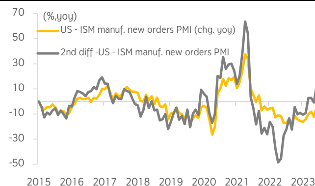
Figure 3: US - ISM Manuf. New Orders PMI vs 2nd diff