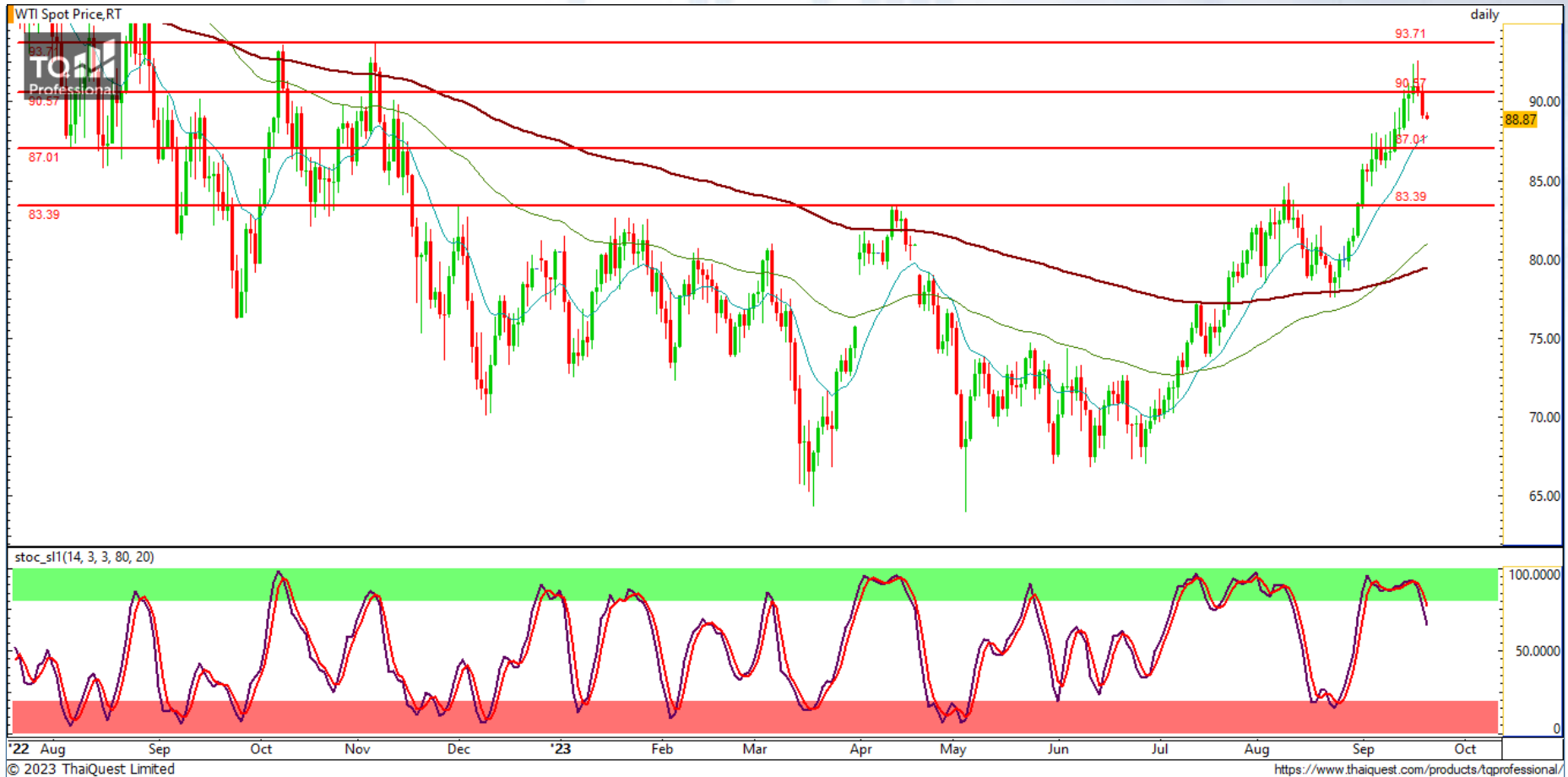
CHART INSIGHT Commodity Market