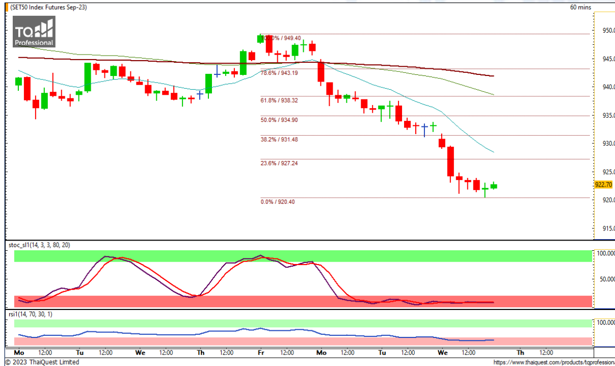
CHART INSIGHT SET50 Index Futures