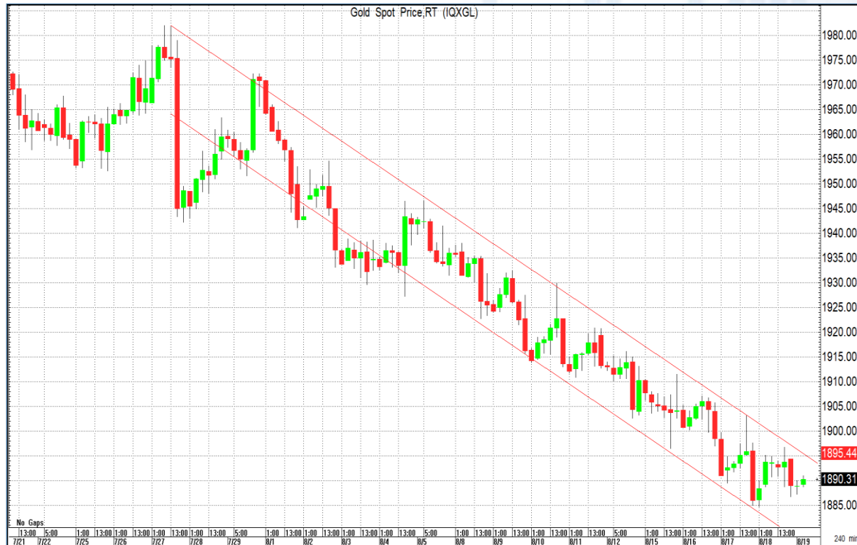
CHART INSIGHT Gold Futures