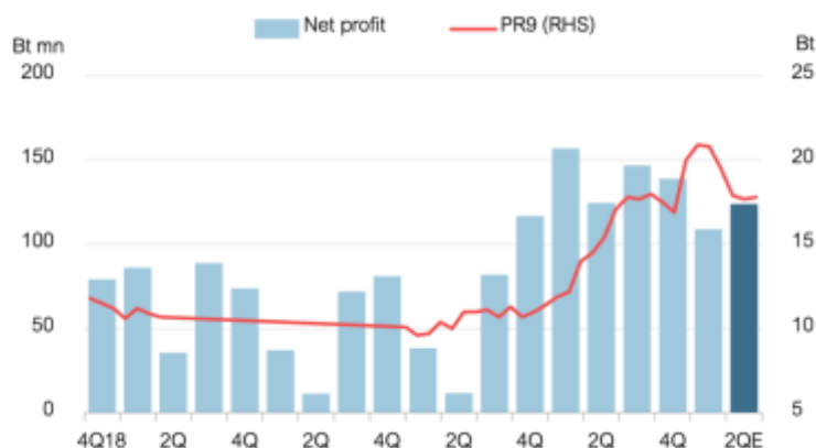
Fig 3: PR9 share prices vs profits