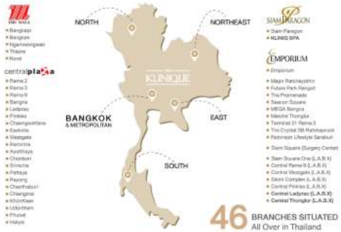
Fig 2: จำนวนสาขา ณ สิ้น 2Q23