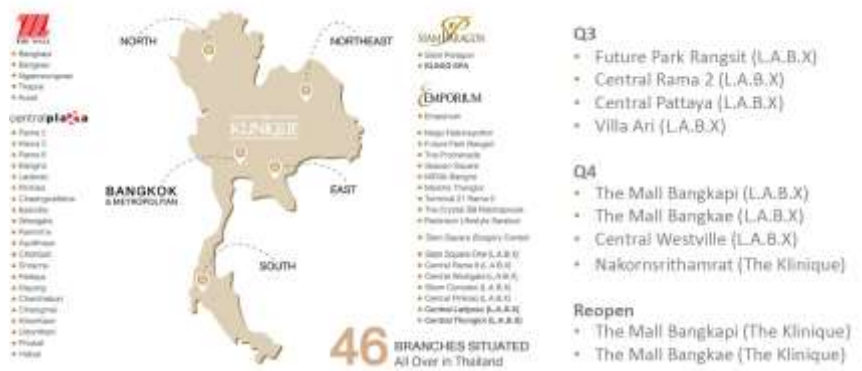
Fig 3: 2H23E Branch expansion