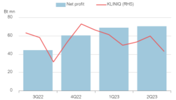
Fig 1: Quarterly net profit vs Share price