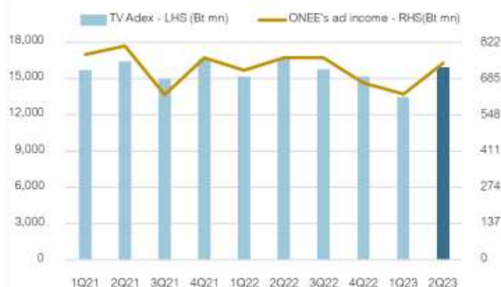
Fig 3: TV Adex vs ONEE's ad income