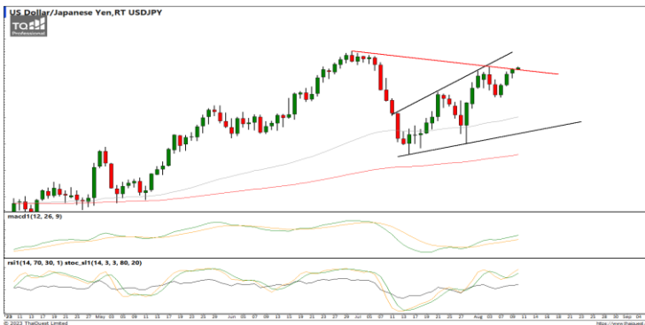
กลยุทธ์ Wait and see.

EURUSD : ภาพรายวัน ราคาแกว่งตัวออกด้านข้างในกรอบจำกัด ขณะที่เครื่องมือทางเทคนิค MACD, RSI และ SSTO ยังอ่อนกำลังอยู่ ทำให้คาดว่าราคามีโอกาสแกว่งตัวออกด้านข้างได้ดี แนวรับ 1.0940 / 1.0911 แนวต้าน 1.1050 / 1.1150