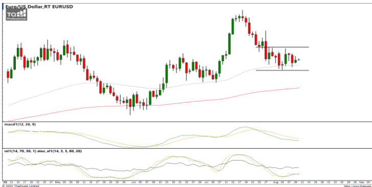
กลยุทธ์ Trading ในกรอบ 1.0911 – 1.1050

USDTHB : ภาพรายวัน ราคาแกว่งตัวขึ้น พยายามทำจุดสูงสุดใหม่ในภาวะระยะสั้นต่อเนื่อง ขณะที่เครื่องมือทางเทคนิค MACD และ RSI ให้สัญญาณซื้อ แต่ SSTO อยู่ในภาวะ Overbought ทำให้คาดว่าราคามีโอกาสแกว่งตัวออกด้านข้างอิงทางบวกได้ แนวรับ 34.60 / 34.30 แนวต้าน 35.00 / 35.30