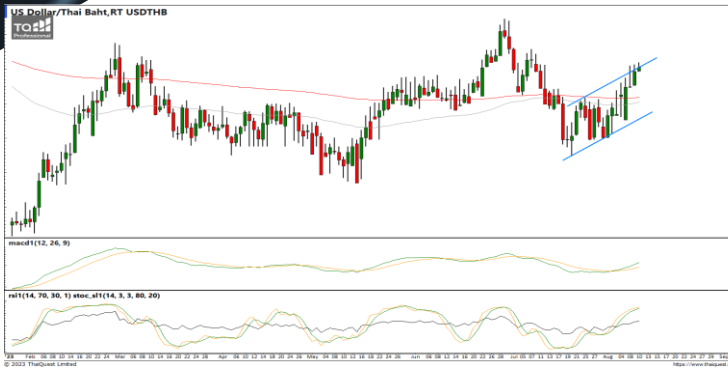
กลยุทธ์ Trading ในกรอบ 34.30 – 35.30

38.2%: 119.29 51.25%: 108.98 61.6%: 99.19