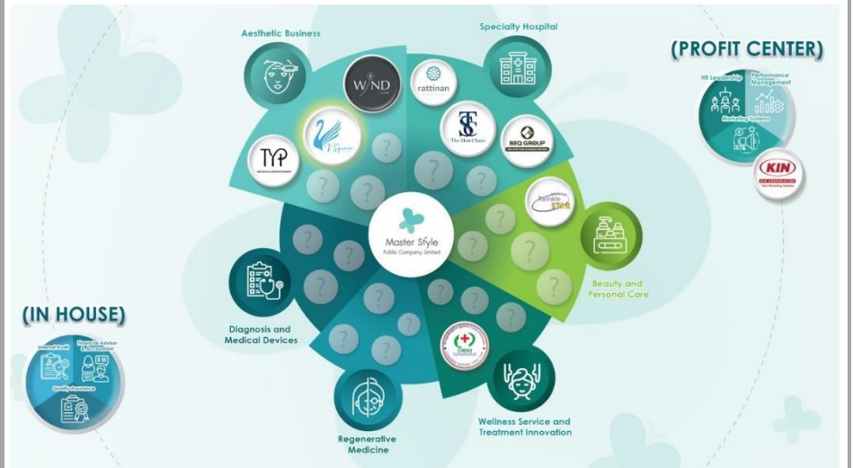
Fig 3: อาณาจักรของ MASTER เดินหน้าสู่รูปแบบ Specialty Hospital ที่ใหญ่ที่สุด