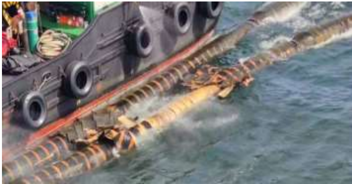
Fig 1: Oil leak in Chonburi