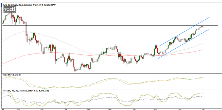
กลยุทธ์ Hold Short 145.00 รอเปิดเพิ่ม 146.00 Stop >147.00

แนวรับ 1.0887 / 1.0835 แนวต้าน 1.0918 / 1.0977