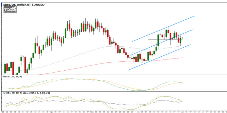
กลยุทธ์ Hold Short 1.0958 Target 1.0720 Stop >1.1012

แนวรับ 35.00 / 34.90 แนวต้าน 35.40 / 35.70