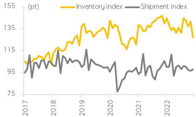
Figure 2: Domestic inventory is on the downtrend